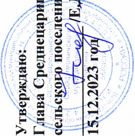
График проведения новогодних и рождественских праздничных мероприятий по Среднеазицкнскому сельскому поселению на 2023-2024 гг..